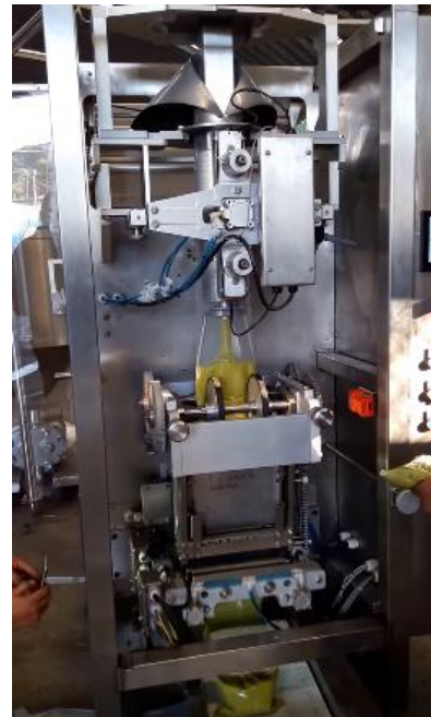
Puesta en marcha con producto.