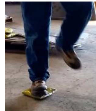
Resistencia alcanzada en el sellado.