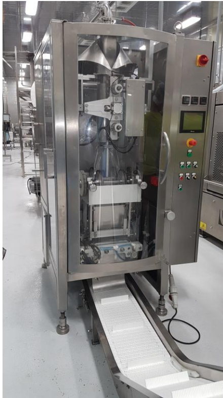
Puesta en marcha en vacío.